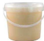
Házi sertés zsír 1kg 298Ft