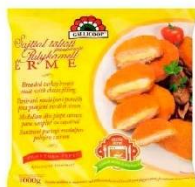
Gallicoop sajtos és sajtosonkás pulykaérme 1kg 980Ft