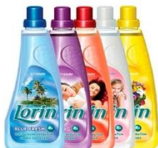
Lorin öblítő 1l több szín 298Ft