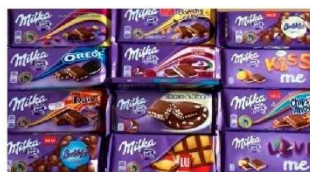
Milka csoki 100gr több íz 249Ft