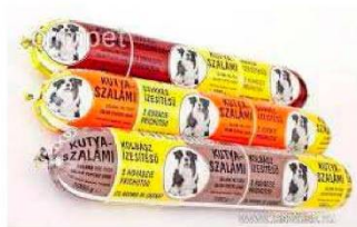
Kutyaszalámi 1kg 175Ft