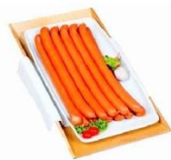
Juhász pálcika virsli 990Ft/kg